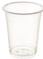
SD 14 OZ. D92 PET

DIAMETER 89.4 HEIGHT 110.0 PCS/BAG 50 PCS/CARTON 1,000