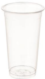
SD 20 OZ. D92 PET

DIAMETER 90.0 HEIGHT 9.0 PCS/BAG 50 PCS/CARTON 1,000