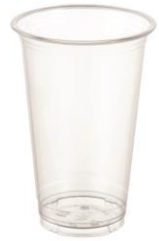
SD 16 OZ. D92 PET

DIAMETER 92.3 HEIGHT 107.0 PCS/BAG 50 PCS/CARTON 1,000