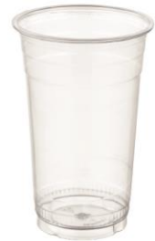
SD 22 OZ. D98 PET

DIAMETER 98.4 HEIGHT 130.0 PCS/BAG 50 PCS/CARTON 1,000