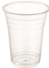
SD 16 OZ. D98 PET

DIAMETER 92.0 HEIGHT 136.5 PCS/BAG 50 PCS/CARTON 1,000