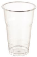
SD 12 OZ. D85 PET

DIAMETER 85.0 HEIGHT 115.0 PCS/BAG 50 PCS/CARTON 1,000