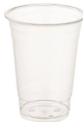
SD 20 OZ. D98 PET

DIAMETER 92.0 HEIGHT 150.0 PCS/BAG 50 PCS/CARTON 1,000