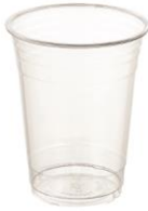
SD 12 OZ. D90 PET-A

DIAMETER 85.0 HEIGHT 115.0 PCS/BAG 50 PCS/CARTON 1,000