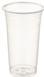
SD 20 OZ. D92 PET-A

DIAMETER 92.6 HEIGHT 150.5 PCS/BAG 50 PCS/CARTON 1,000