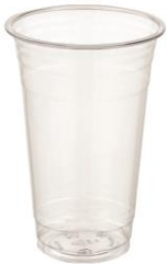
SD 16 OZ. D92 PET-A

DIAMETER 92.0 HEIGHT 136.0 PCS/BAG 50 PCS/CARTON 1,000